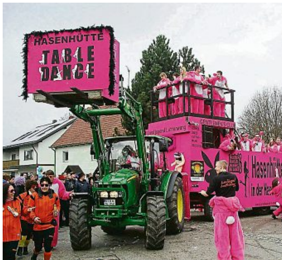
Die Table-Dance-Bar in der Brucker Hasenheide war ein großes Thema beim Faschingszug.