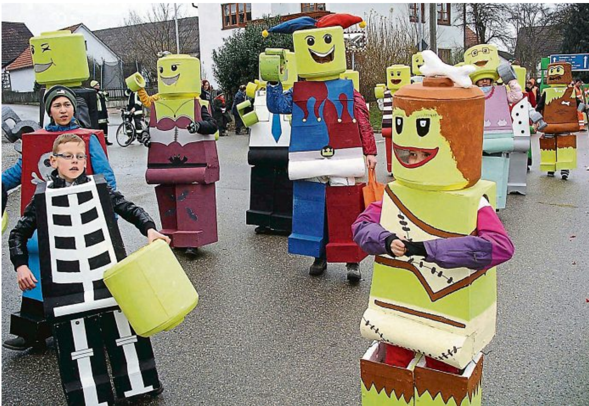
Als Lego-Figuren verkleidet zogen die Moorenweiser Kinder durch die Straßen der Gemeinde.

Eine Sonderinformation des Fürstentagblatt Nr. 69 vom 24. März 2014