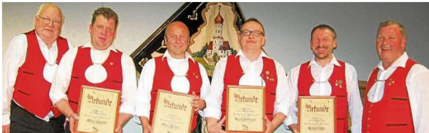
Bis spät in die Nacht wurde im Vereinsheim gesungen.

Der Kinderpark der Krankenpflege und Nachbarschaftshilfe Moorenweis e.V.,