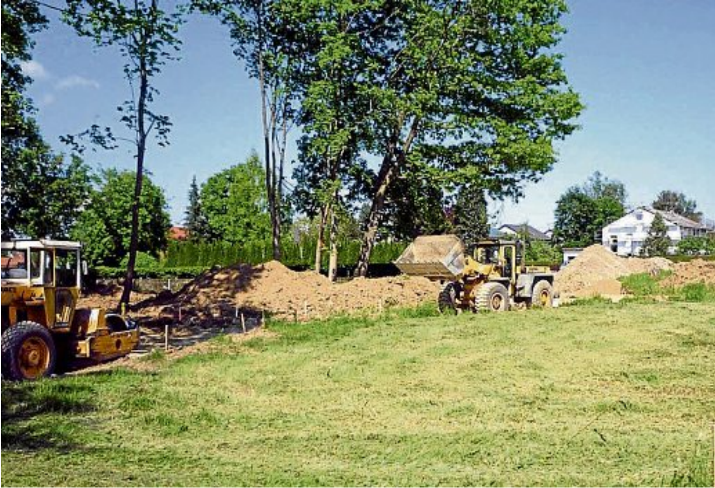
Die Bagger rollen: Mit der Erweiterung des gemeindlichen Friedhofs wurde Anfang Mai begonnen.