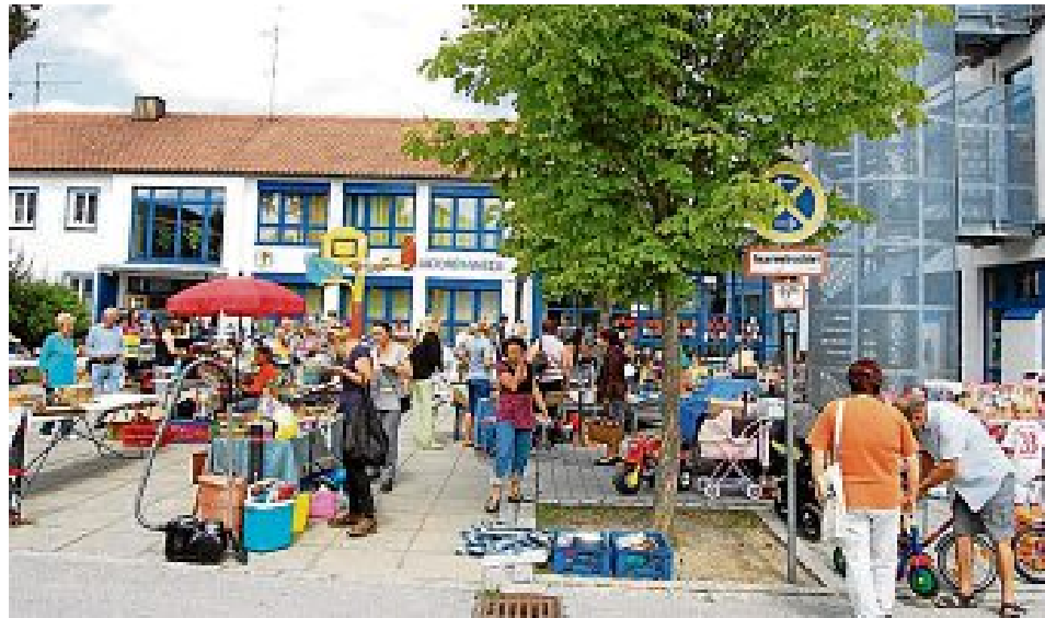
Stöbern macht bei schönem Wetter richtig Spaß...

Zur Einstimmung aufs Ferienprogramm gibt es hier noch ein paar Fotos vom Flohmarkt, der vergangenes Jahr wie immer auf dem Schulhof abgehalten wurde: Der Flohmarkt im Rahmen des Ferienprogramms 2012 fand bei bestem Wetter statt, so dass der Andrang groß und die Stim-