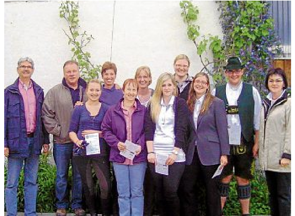
Die Prüflinge fürs Longierabzeichen wurden gut vorbereitet.