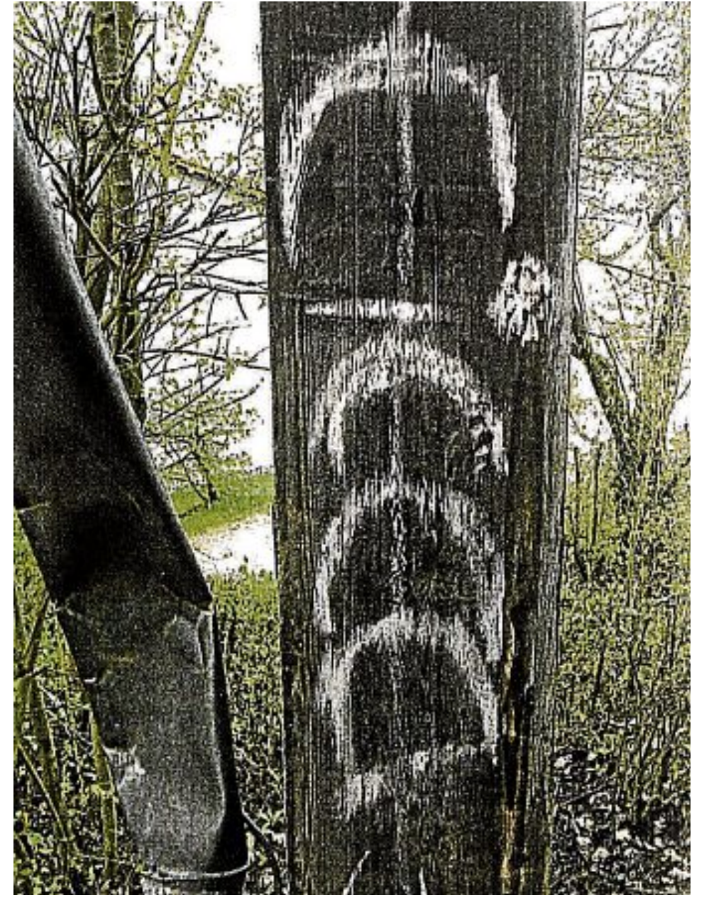
Auch ein Regenrohr wurde zerstört, der Stamm beschmiert.