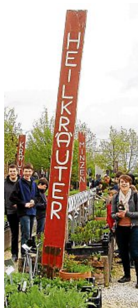
Inspiration für den Garten.