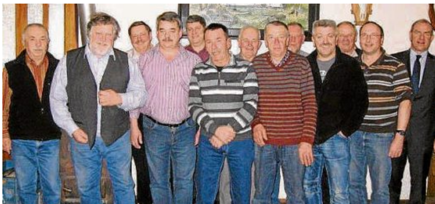
Jetzt ist die Vorstandsriege komplett: der Veteranen- und Soldatenverein.