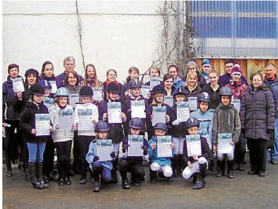
Auch im Mai gab es wieder Prüfungen.