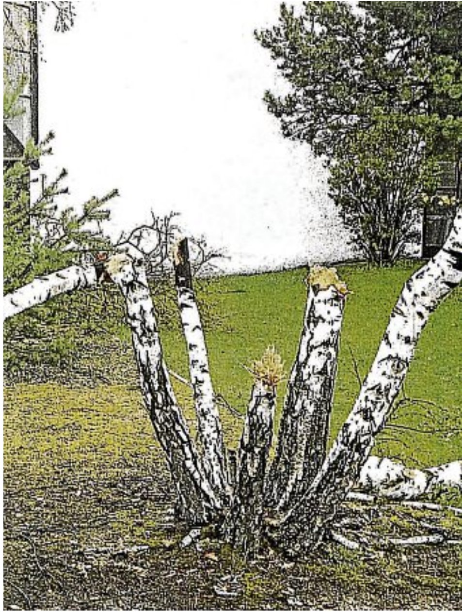
Brutal zugerichtet: Die Birken wurden abgeknickt.