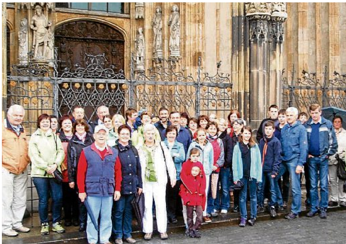
Begeisterte Reisegruppe: die Moorenweiser Gartler bei ihrem Ausflug.