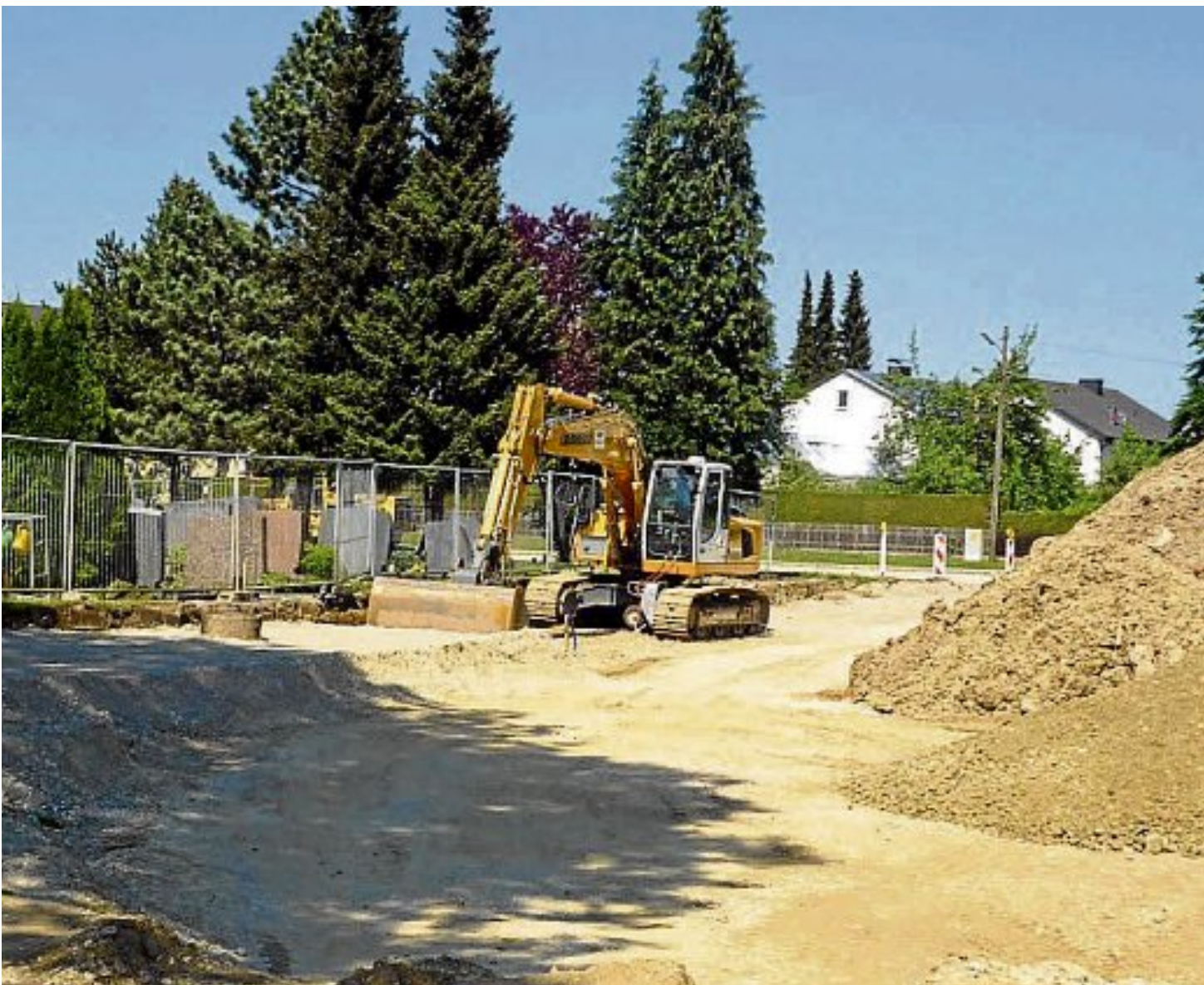
Tief gegraben wird für die Verlegung von Versorgungsleitungen.

gen vorgenommen. Die Baukosten liegen bei rund 300.000 Euro. Auf dem neuen Friedhofsareal soll in einem späteren Bauabschnitt auch eine Aussegnungshalle errichtet werden.