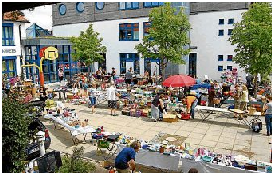
...und die Stimmung war 2012 natürlich auch super.

mung super war. Der ganze Pausenhof und ein Teil der Wiese waren belegt. Es wurde verkauft und gefeilscht was das Zeug hielt und so manches gute Stück wechselte den Besitzer. Auch die Kinder