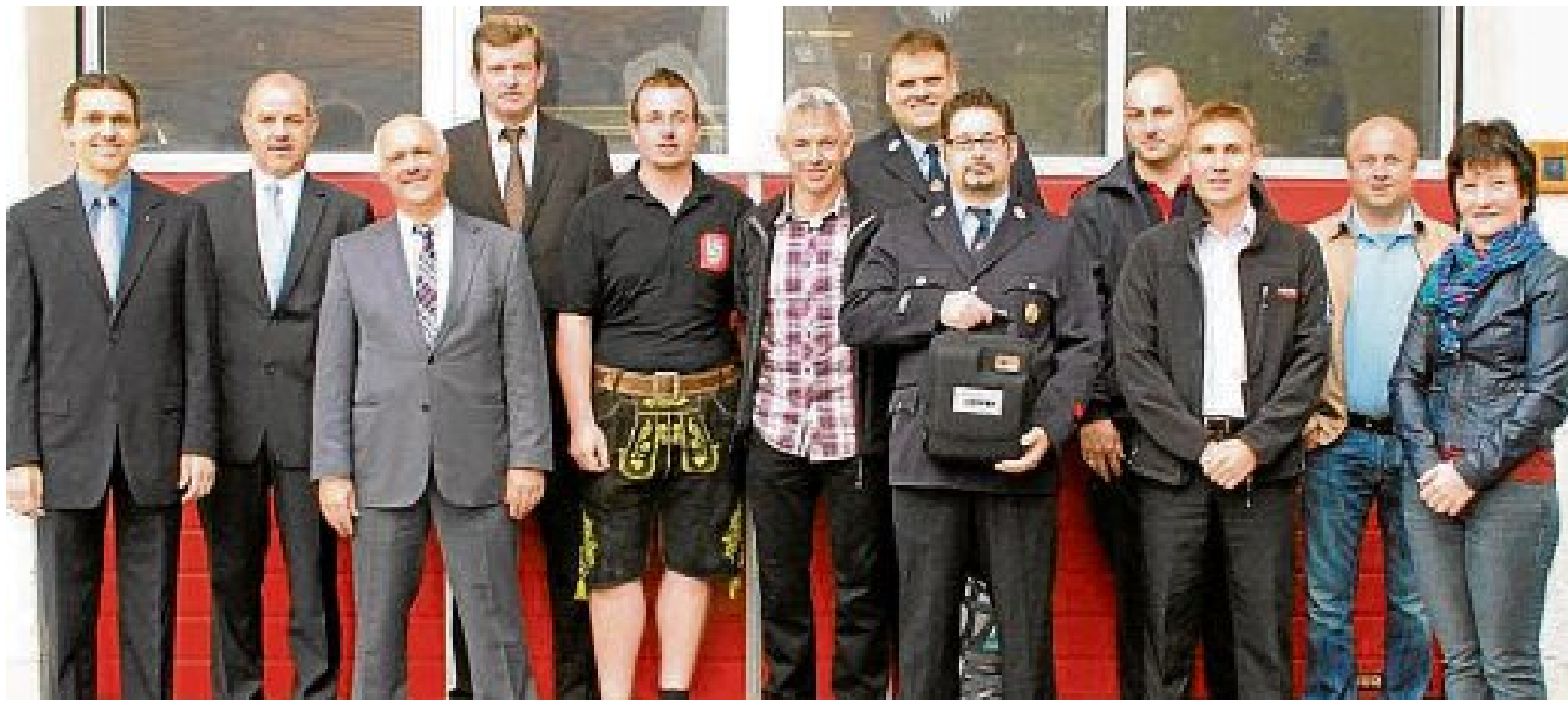
Freude: Die Steinbacher Feuerwehr mit dem neuen Defibrillator (in der Bildmitte).

Da der Defibrillator für alle Steinbacher zugänglich ist, wurden mehrere Kurse organisiert, die sowohl die Erstversorgung von Hilfsbedürftigen als auch die Bedienung des Gerätes zum Thema hatten. So sollten die Ängste abgebaut werden, das Gerät im Ernstfall auch zu benutzen. Der Möglichkeit, einen Erste-Hilfe-Kurs zu besuchen kamen dann auch nicht nur die Mitglieder der Freiwilligen