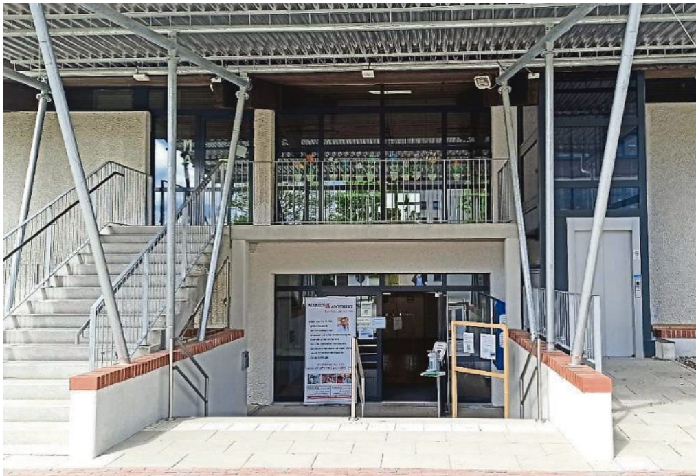
Das Testzentrum in der Mehrzweckhalle Moorenweis ist eröffnet.