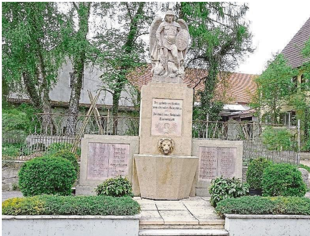
Frisch restauriert: das Kriegerdenkmal in Eismerszell.

Eine Sonderinformation des Fürstenfeldbrucker Tagblatt Nr. 134 vom 15. Juni 2021