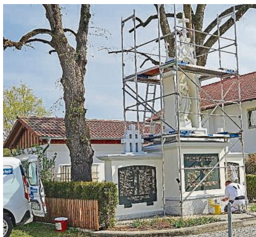
Eingerüstet: Ein Fachmann bringt das Moorenweiser Denkmal auf Vordermann.