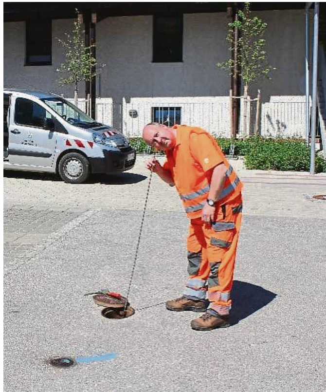
Genau hinhören heißt es für den Wasserwart bei der Suche nach Lecks im Leitungsnetz.

In der jüngeren Zeit war das nach oben korrigieren in vielen unserer Nachbarge-