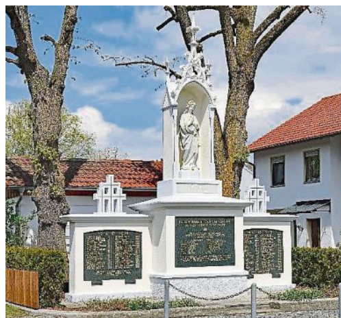
Nach den Arbeiten: Das Mahnmal erstrahlt in neuem Glanz.