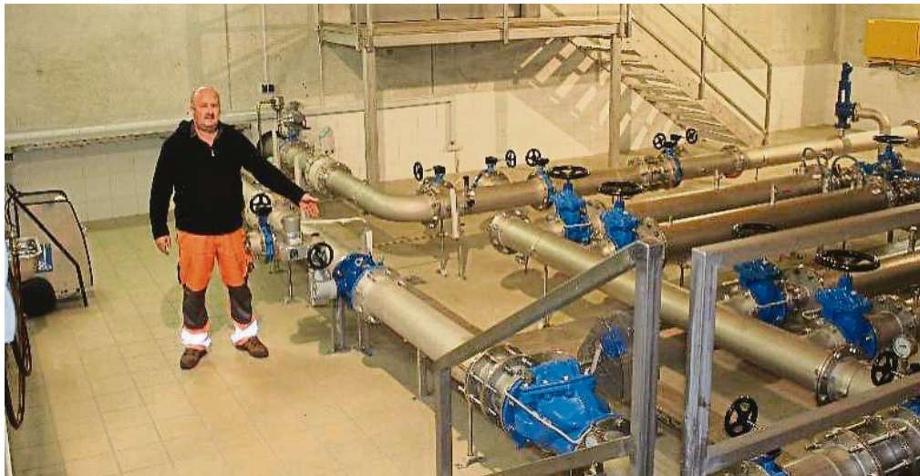
... und bei den Pumpen.

neu erstellte Wasserversorgung. Grunertshofen, Purk, Langwied und Römertshofen wurden schon seit den 70er-