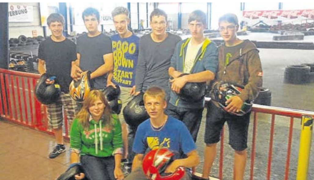
Beim Ausflug auf der Kart-Bahn: Die U 18 der Moorenweiser Feuerwehr.