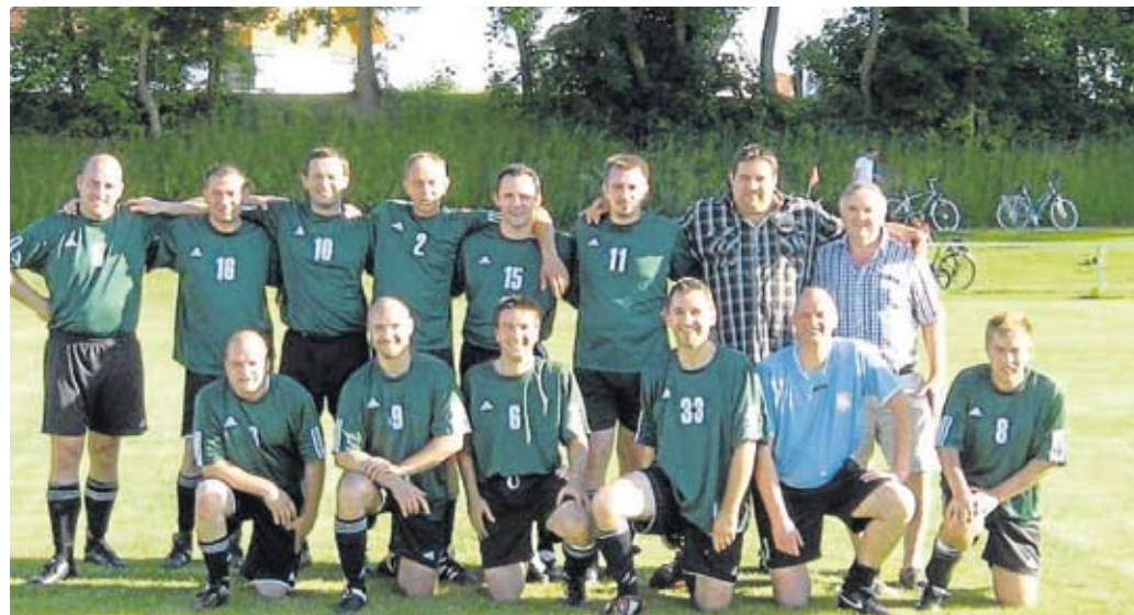
Mit viel Herzblut war die Moorenweiser Truppe dabei, am Ende wartete eine Brotzeit.