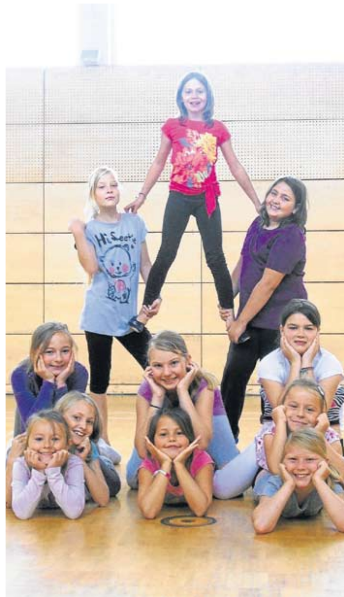
Akrobatisch wurde es beim Tanz.

selt, gerührt, Servietten gefaltet und natürlich mit großem Appetit das leckere Menü genossen. außerdem gab es „Tanzen wie die Stars“. Eifrig studierten die Mädchen einen Video-Clip-Tanz ein.