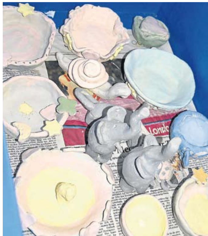
Auch verschiedene Schalen wurden getöpft.