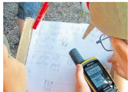
...um erfolgreich zu suchen.