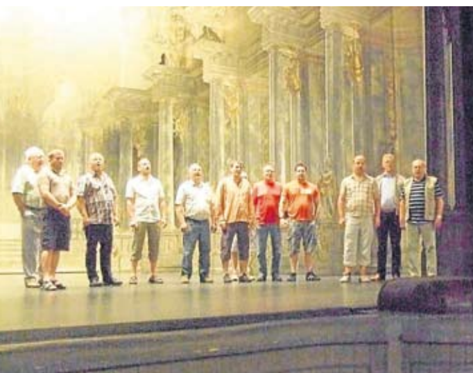
Auf der Bühne des Bayreuther Opernhauses: Die Sänger vom MGV Steinbach.