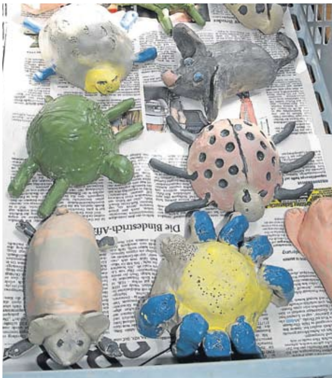
Allerhand Tiere formten die Kinder im Ferienprogramm.

Zwölf Kinder durften mit dem Elternbeirat des Hauses für Kinder einen Vormittag lang mit Martin Piepenburg den Forstlichen Versuchsgarten in Grafrath erforschen. Steine wurden in Waldkobelde verwandelt. Mit Becherlupen wurden viele kleine Tiere am Waldboden entdeckt: Spinnen, Hundertfüßer, Asseln, Schnecken und auch einen Frosch und eine Kröte. Außerdem durften die Kinder Schädelknochen von Reh und Fuchs anschauen und auch anfassen.