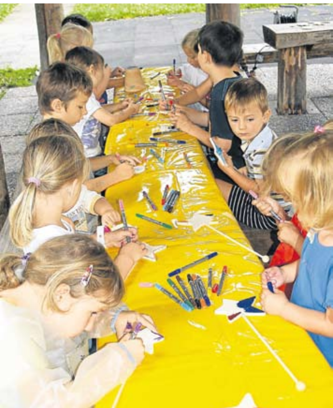
Fleißig am Malen und Klecksen waren die Kinder.