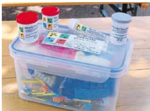
Viele Utensilien waren nötig...

Der zweite Tag war dann den „Kleinen“ vorbehalten. Diese Route erstreckte sich deswegen auch „nur“ über 4 Stationen bis zum Ziel. Wobei auch hier die Fragen alles andere als einfach waren. Aber die Kinder trotzten nicht nur den Kapriolen des Wetters, sondern auch der Hartnäckigkeit der letzten, extrem gut versteckten, großen Dose. Zum Abschluss gab es dann jeweils noch eine kleine Brotzeit, bevor man sich wieder auf den Rückweg nach Hause machte.