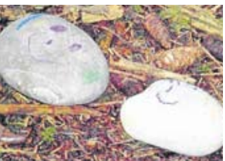
Steinige Waldkobelde