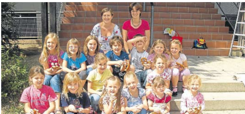
Viel Spaß hatten die Kinder bei den Töpfer-Kursen.