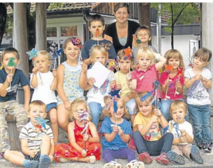
Am Ende werden die Werke präsentiert.

Zauberstäbe aus Holz bemalen und anschließend mit Schmucksteinen und Bändern verzieren. Zum Abschluss gab es eine gemeinsame Brotzeit.