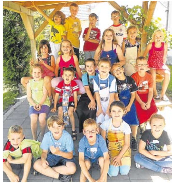
Fleißig waren die Teilnehmer bei allen Aufgaben.

82272 Moorenweis · Bergstr. 2 · Tel. 081 46/1255 · Fax 081 46/7454