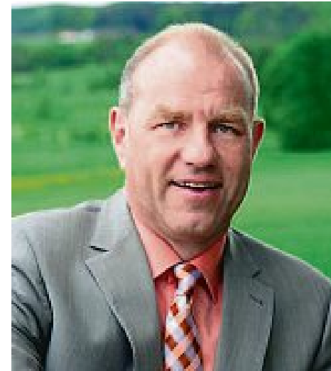
Bürgermeister Joseph Schäffler

Auch Betriebe müssen unabhängig von ihrem Sitz zuverlässig angeschlossen werden. So werde ich den Vorschlag unterbreiten, einen „Masterplan“ als Grundlage für die weitere Zukunft zu erarbeiten, der eine Versorgung