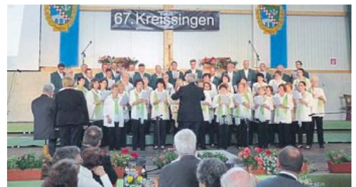
Der gemischte Chor