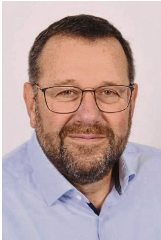
Rudi Keckeis, zweiter Bürgermeister

Ein herzliches Grüß Gott an alle Bürgerinnen und Bürger in Moorenweis aus dem Rathaus.