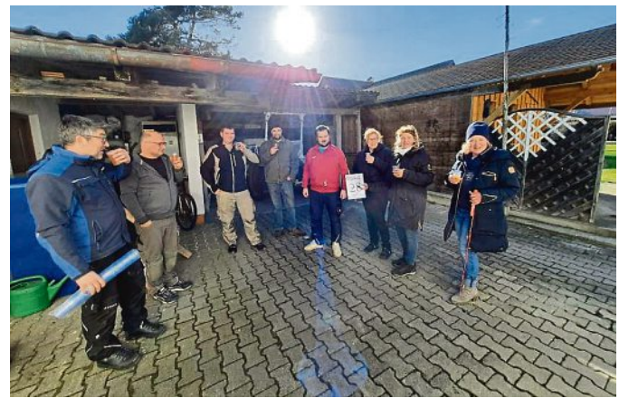
Es wurde nichts dem Zufall überlassen: Der Aperol Sprizz wurde im Vorfeld von der „Alten Garde“ abgeschmeckt.

Bei der ultimativen Faschingszug-AfterShow Party vor und in der TSV-Halle herrschte eine hervorragende Stimmung. Der engagierte DJ Mike fand die richtige Musik für Jung und Alt und konnte