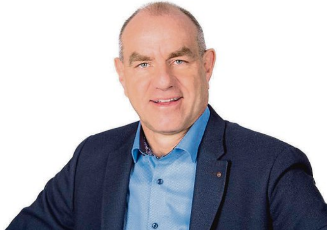
Joseph Schäffler , Erster Bürgermeister.

Um einen effektiven Luftaustausch in den Unterrichtsräumen zu erhalten und zur Verminderung der Konzentration von virusbehafteten Partikel wurde in den vergangenen Wochen zudem eine stationäre raumluftechnische Anlage (RLT) in die Klassenzimmer eingebaut. Wir sehen hier einen großen Vorteil gegenüber der Aufstellung von Raumlüftern oder Umluftgeräten. Auch bei sommerlichen Temperaturen kann so eine angenehme, lernunterstützende Raumat-