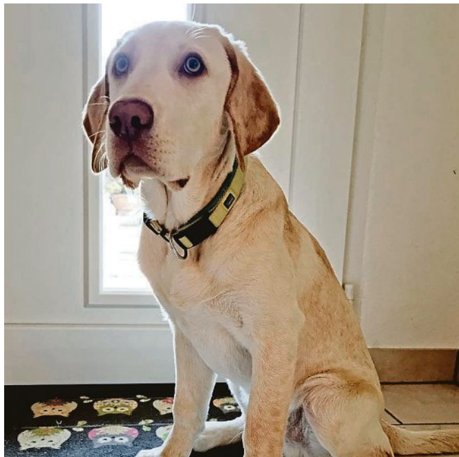
Bester Freund des Menschen: Hunde sind sehr beliebt als Haustiere. Doch über ihre Hinterlassenschaften gibt es oft Streit.

Wer von den Hundebesitzern der Auffassung ist, es werde ja schließlich Hundesteuer an die Gemeinde gezahlt, also müsse doch im Gegenzug die Kommune - sprich Allgemeinheit - die