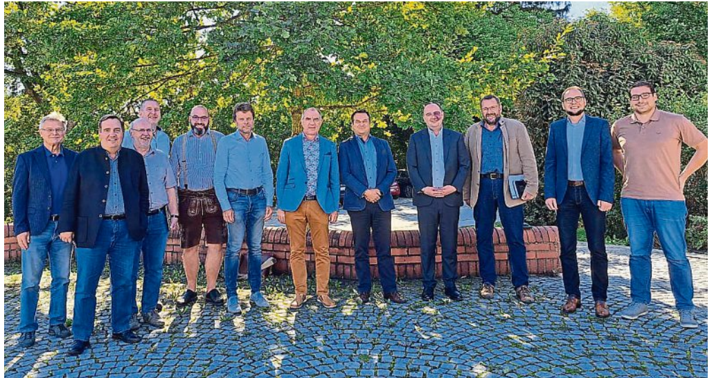
Die Bürgermeisterrunde beim Besuch in Moorenweis.

Ohne Wind und Photovoltaik wird die künftige Stromversorgung nicht möglich sein. Deshalb hat die Bundesregierung in verschiedenen Gesetzesinitiativen die Grundlage für einen beschleunigten Ausbau der Windkraft gelegt. Unter anderem muss der Freistaat Bayern bis 2027 1,1 Prozent und bis 2033 1,8 Prozent seiner Fläche für die Nutzung von Windkraft ausweisen.