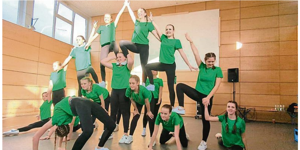
Die neue Nachwuchsgarde des TSV.

Für die Turnergarde Moorenweis ist das ein doppelter