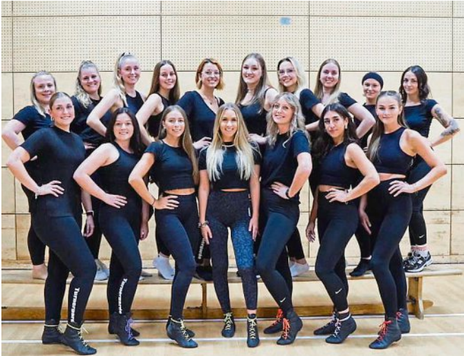
Die aktuelle Turnergarde des TSV.