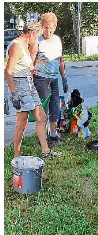
Blumen- und Gartenfreunde

Die Garten- und Blumenfreunde unterstützen die Initiative „Unser Dorf soll grüner werden“. Vorangegangen war eine Ortsbesichtigung von interessierten Bürgern mit dem Fahrrad, an der sich auch Vertreter der Gemeinde Moorenweis beteiligt haben. Es wurden mögliche Flächen besichtigt, die sich für eine Bepflanzung eignen. Eine dieser Flächen haben Mitglieder der Garten- und Blumenfreunde am 11. September 2023 mit Rosenstöcken und einer Säulenfelsenbirne bepflanzt. Es handelt sich hierbei um eine Fläche an der Kreuzung Ammerseestraße mit der Eismerszellerstraße. Der Verein führte die erforderlichen Arbeiten ehrenamtlich durch und übernahm auch die Kosten für die Pflanzen. Für die Pflege stehen ebenfalls Mitglieder des Vereins zur Verfügung.