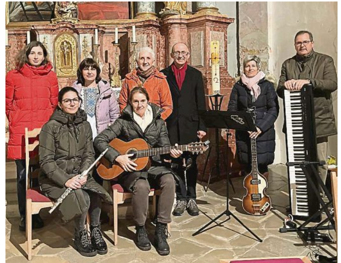
Der Neue Chor

Es wurden altbekannte Melodien wiederholt, aber auch neue Lieder in allen Stimmlagen gründlich und mit viel Feingefühl und Humor einstudiert. Zur musikalischen Umrahmung des Friedensgebets wurde die Band des Neuen Chores eingeladen. Wie im vergangenen Jahr fand die Veranstaltung in der Gemeinde Moorenweis großen Anklang.