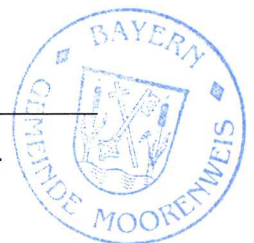
Schäffler 1. Bürgermeister